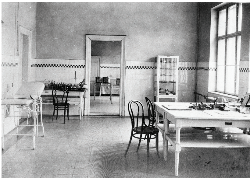
■ A rendelőintézet nőgyógyászati része