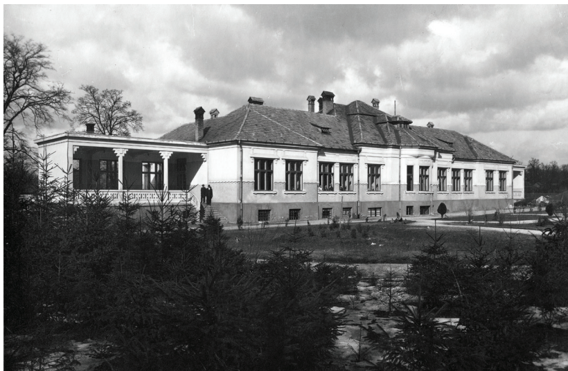
■ A sok tüdőbajjal küszködő bányamunkás kezelésére 1921-ben létrehozott tüdőszanatórium épülete, amely ma a Kossuth Lajos Gazdasági és Humán Technikum otthona