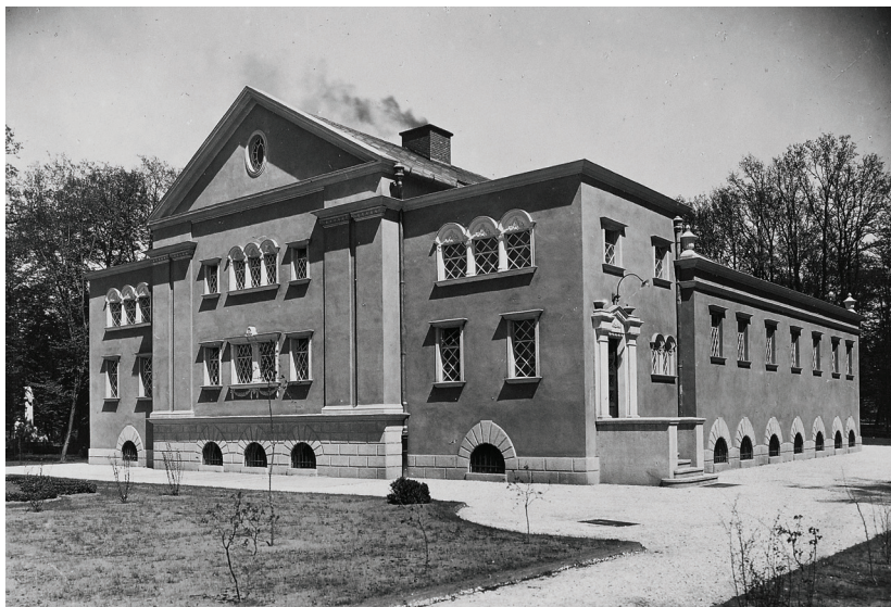
▪ A bányamunkások mozgásszervi problémáinak kezelésére 1927-ben épített Gőzfürdő