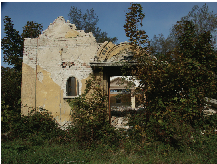
90 ■ Az evangélikusok templomának homlokzata 2020-ban