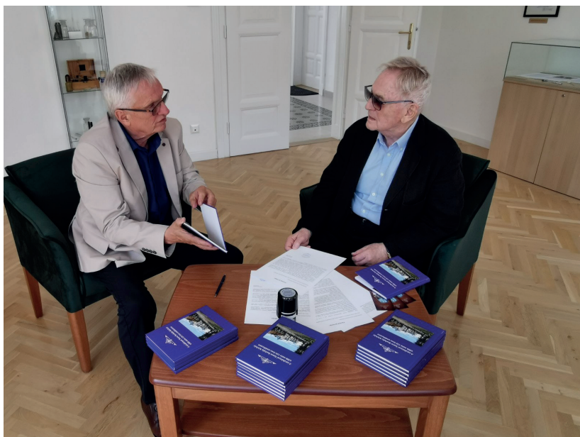
■ A kiállítóval egybekötött könyvbemutató