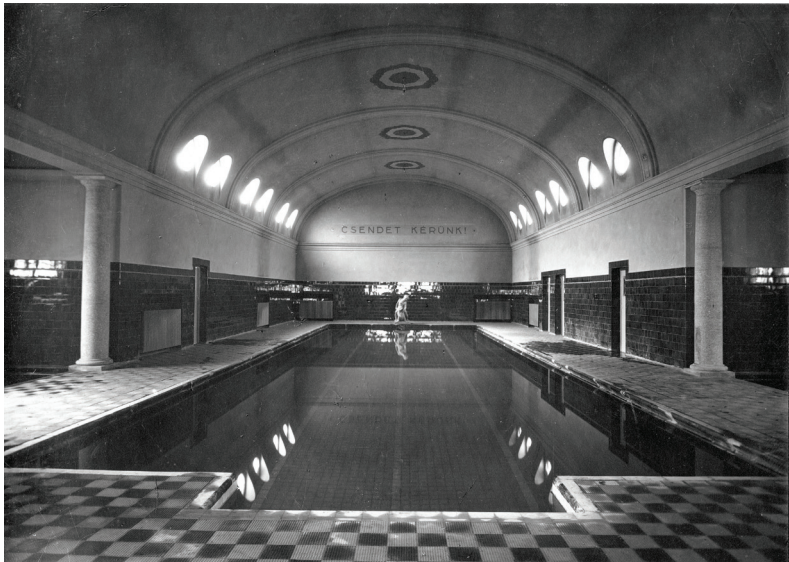
■ A Gőzfürdő nagymedencéje