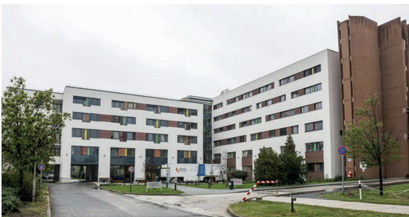
▪ Szent Borbála Kórház, H épület