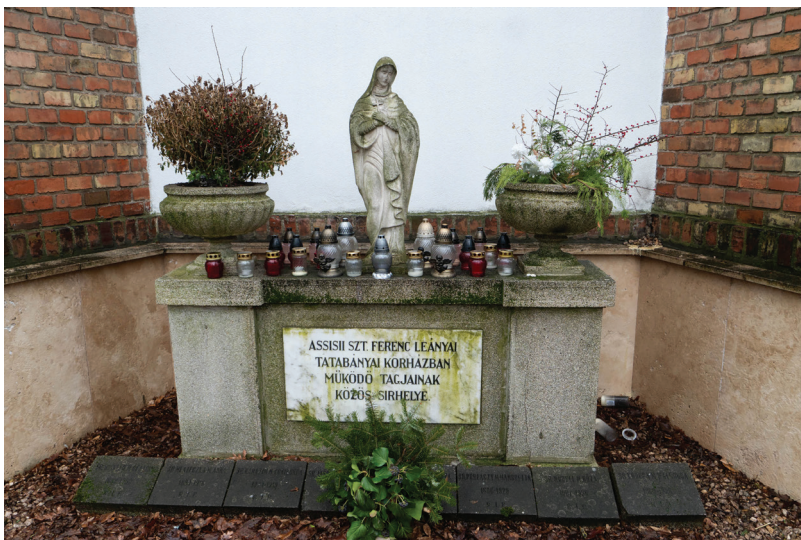
▪ A nővérek síremléke a Szent István templom apszisánál