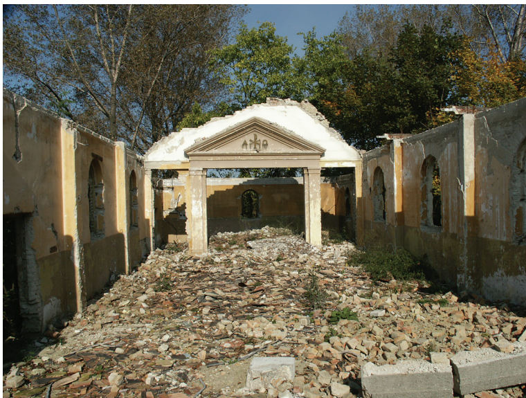
■ Az evangélikus templom belseje 2020-ban