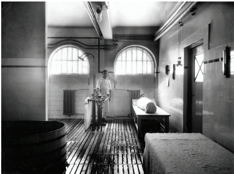
■ Hévízről hozott iszappal kezelték a betegeket