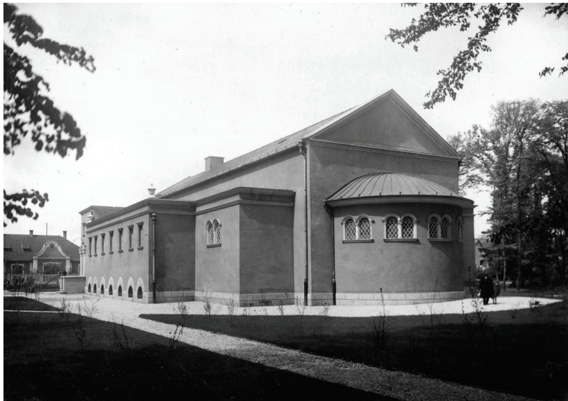
84 ▪ A Gőzfürdő épületének a Liget felőli oldala