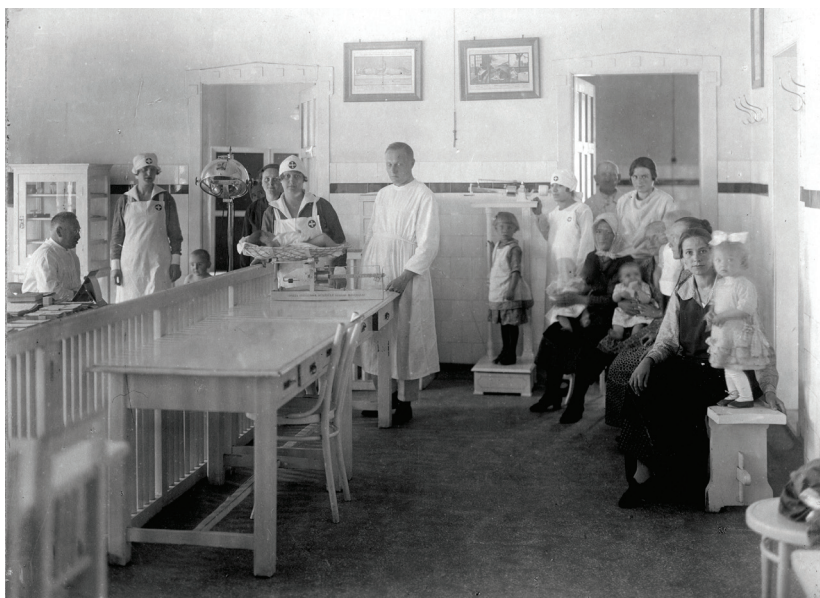
80 ■ Az Országos Stefánia Szövetség Anya- és Csecsemővédő-intézete a rendelő épületében