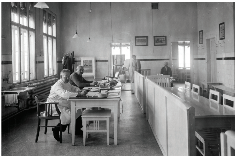
■ A rendelő felnőtt betegek kezelésére szolgáló helyisége