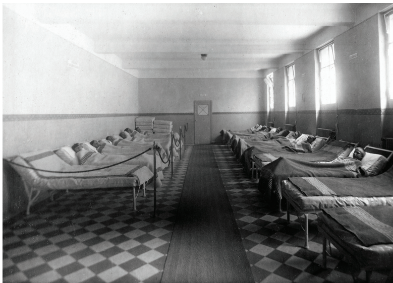
▪ A Gőzfürdő pihenőhelyisége