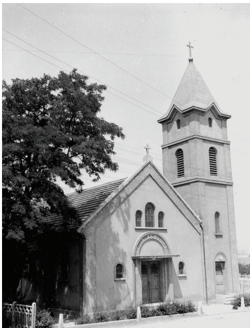
▪ A Hetes telepi piac mellett állt valamikor az evangélikusok temploma