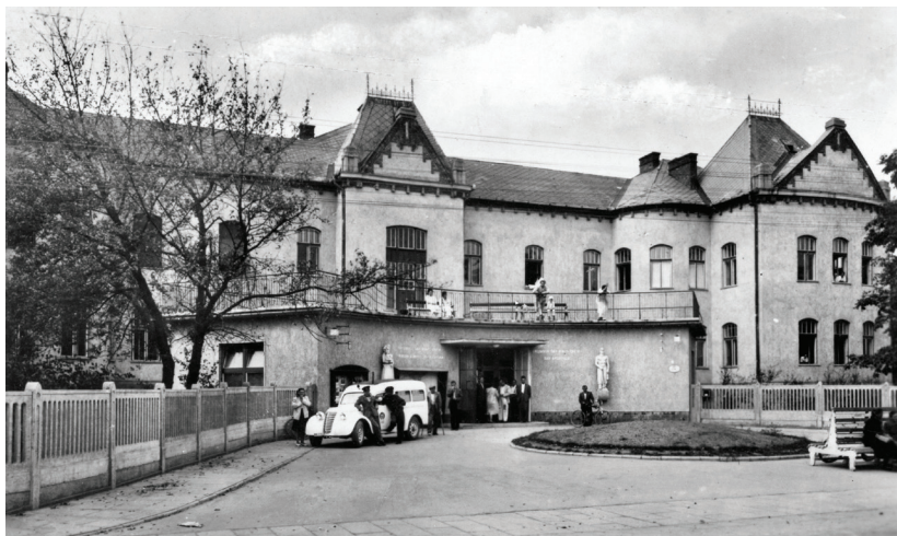
■ A kórház főbejárata elé épített fogadóépület az 1950-es évek végén