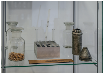
■ Orvosi eszközök