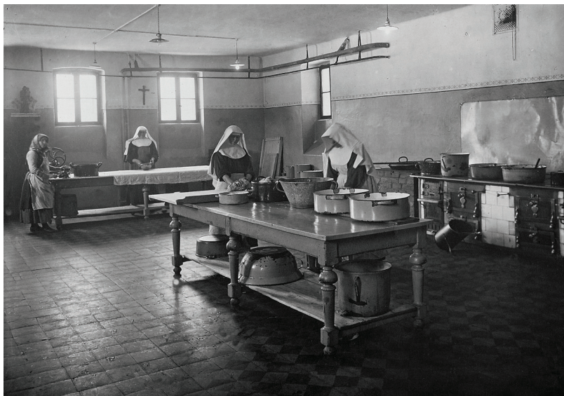
76 ▪ A kórház konyhája