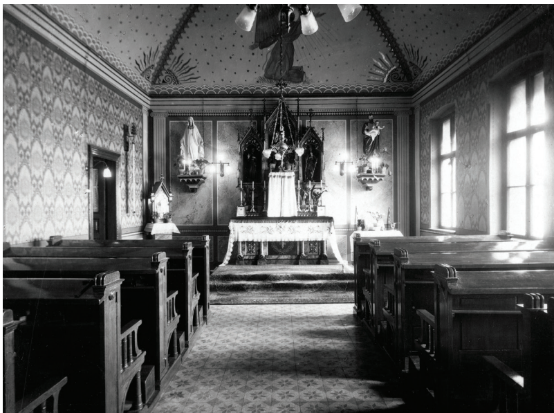
▪ A kórház kápolnájának belső tere