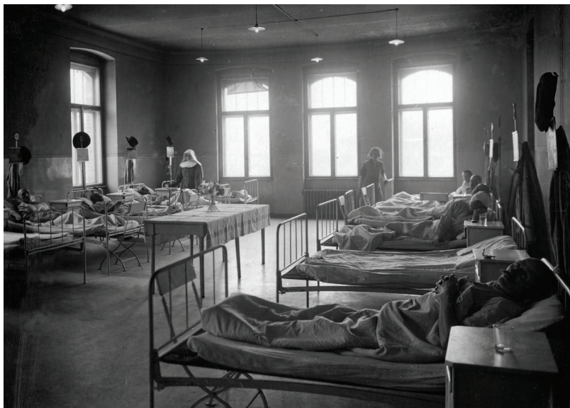
▪ Egy kórterem