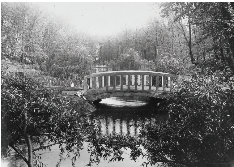
▪ Az 1920-as években parkosított Liget