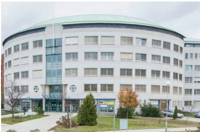
▪ Szent Borbála Kórház, L épület