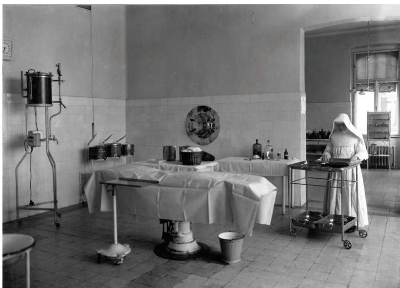
■ A kórház műtője és az ott szolgáló Assisi Szent Ferenc Lányai Kongregációjának nővére